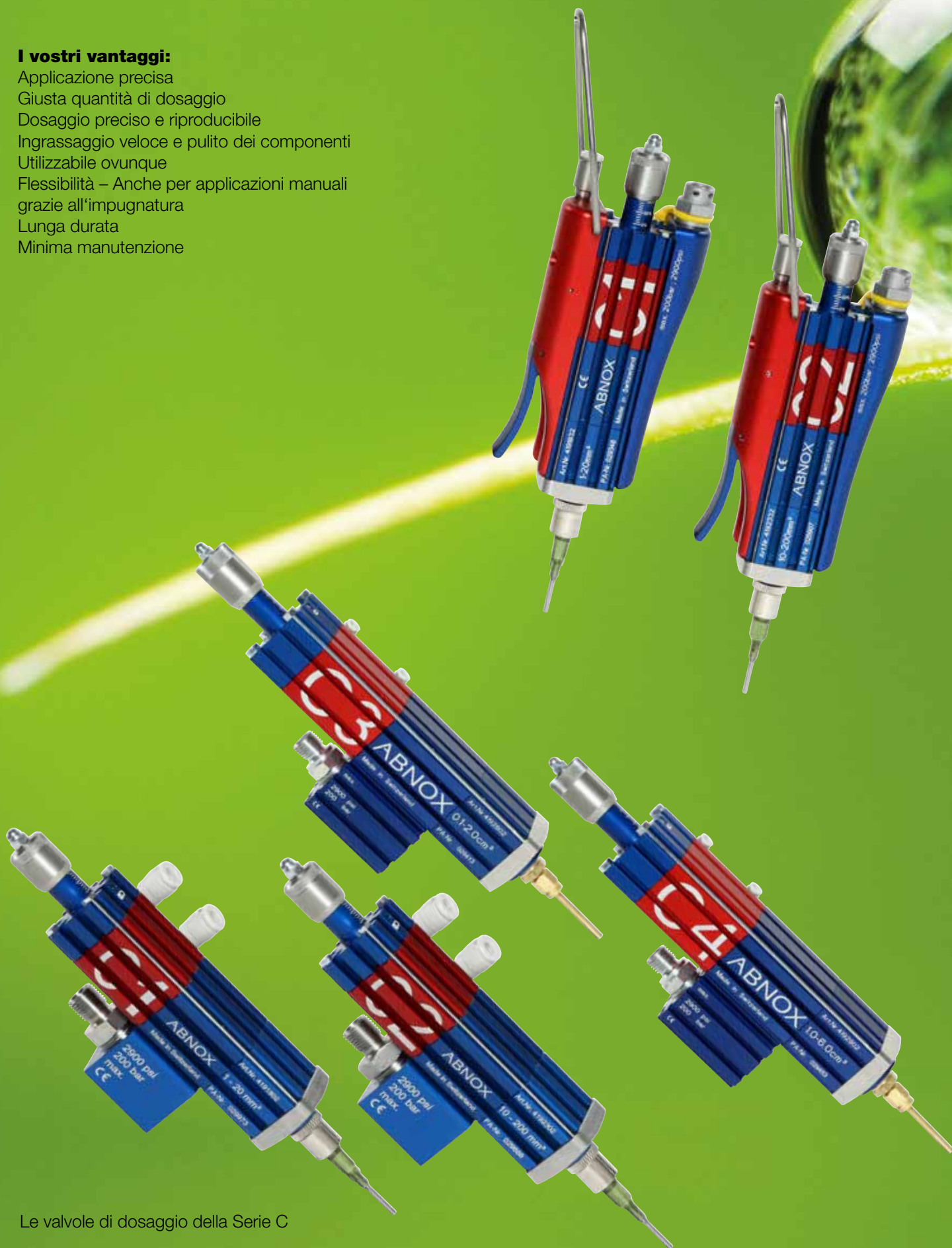
Le valvole di dosaggio della Serie C